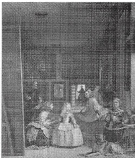
2. Las Meninas