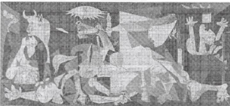
2. El Guernica