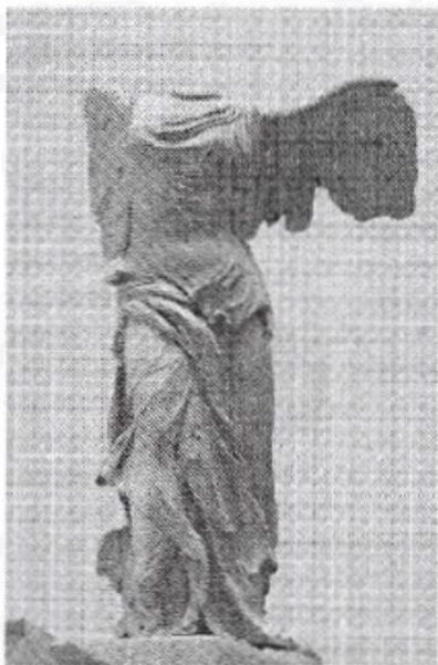
1. Victoria alada de Samotracia